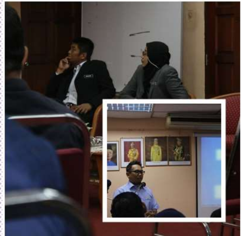
Tempat : Bilik Seminar PDT Sepang